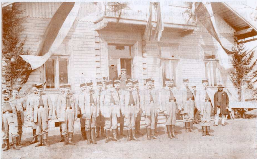
Zakopiański „Sokół” przed sokolnią w Zakopanem ok. 1910 r.

Mimo dobrej bazy zakopiański „Sokół” nie należał do zbyt aktywnych w rozwijaniu tężyzny fizycznej.